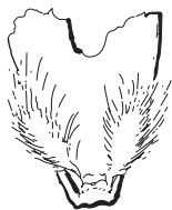
Две чешуйки под цветочной оболочкой